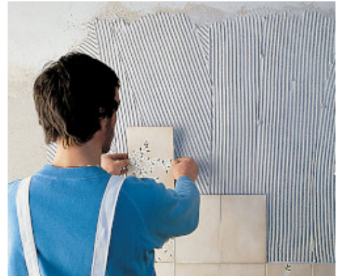
Burkolás hagyományos vakolatra