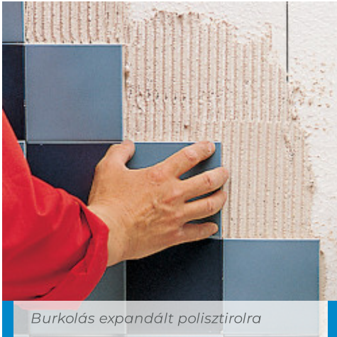
Burkolás expandált polisztirolra