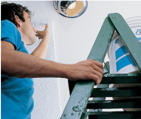
Expandált polisztirol mennyezet ragasztása

Mindig figyelje a ragasztó nyitott idejét. A különféle anyagokat erős nyomással rögzítse a felületen, hogy a jó érintkezés az Adesilex P22 -höz biztosított legyen.