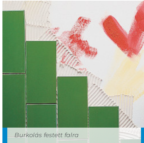
Burkolás festett falra