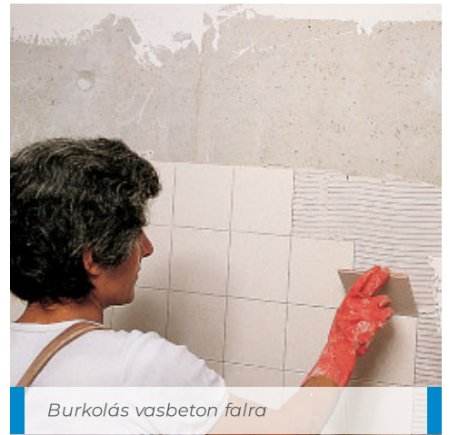
Burkolás vasbeton falra